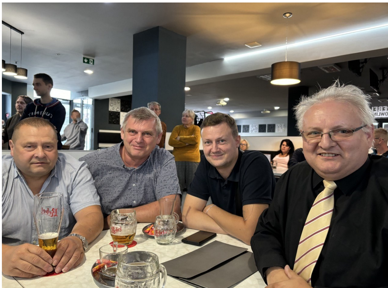
I v roce 2024 proběhlo další společné setkání v Jihlavě členů OO Pro Libertate z celé České Republiky,..